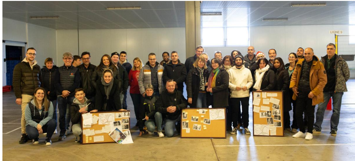
36 joueurs ont enquêté sur le meurtre de Nara Pham

Organiser un Escape Game dans une station de conditionnement, il fallait oser! Pari plus que réussi pour CréaMondes qui nous a concocté un "joli" meurtre à élucider avec une vraie scène de crime, de vrais accessoires, un scénario hollywoodien et des acteurs plus vrais que nature. 2 bonnes heures de rires, d'interrogations et de recherche d'indices, de relevés d'empreintes, bref on y était. Bravo à CréaMondes et aux comédiens ! Un pur bonheur !